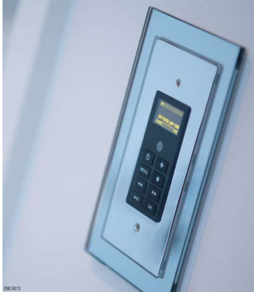
iPod und iPhone – die trendige und portable Musikquelle für alle Generationen.